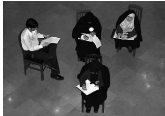
Abb. 2: Teilnehmerinnen und Teilnehmer in einer Übung zum Umgang mit kritischen Stimmen

Der Dialog – je nach Kontext sprechen wir auch vom »Dialogverfahren«, dem »Dialogprozess« oder dem Dialogansatz – steht in der geistigen Tradition des anglo-amerikanischen Quantenphysi-