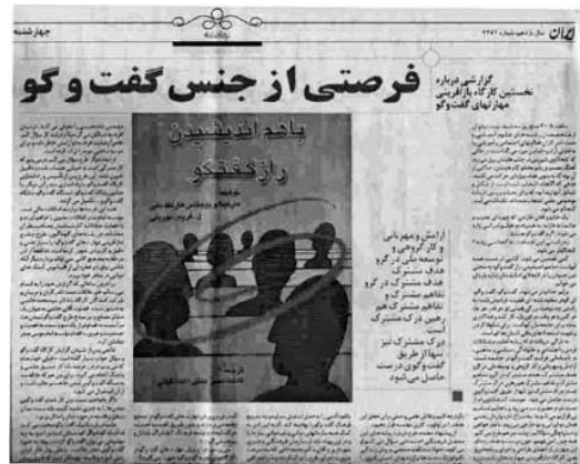
Abb. 5: Chance für den Dialog: Ein Bericht über den ersten Dialog-Workshop – »IRAN«, Teheran, 19. September 2005

des Dialogansatzes in der iranischen Bevölkerung und bildet eine tragfähige Basis für die weitere Dialogarbeit.