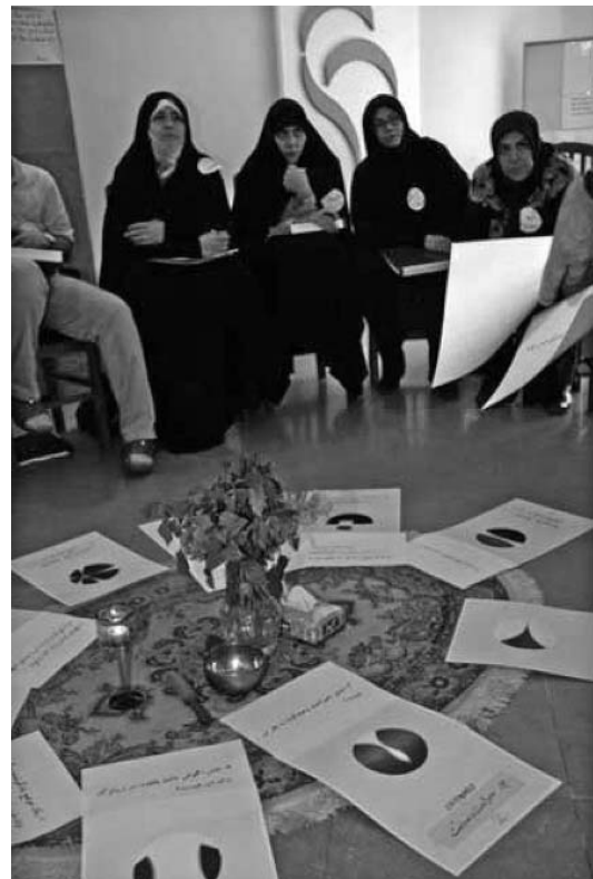
Abb. 3: Die Illustrationen von Werner Ratering zu den Kernfähigkeiten haben sich insbesondere im interkulturellen Dialog bewährt, wo sie eine Auseinandersetzung mit den Ideen ohne die sprachliche Barriere der Übersetzung ermöglichen

In einem der theoretischen Teile wurde beispielsweise ein Modell vorgestellt (mehrschleifiges Lernmodell nach Chris Argyris, z.B. 1997; Argyris & Schoen 1978), das aufzeigt, wie die Hintergründe und Tiefenstrukturen von Ereignissen tiefer ergründet werden können. Als Beispiel diente der Anschlag vom 11. September 2001 auf das World Trade Center in New York.