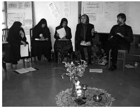
Abb. 4: Interventionen während eines Dialogs

Beispiel für eine kulturbezogen von uns umgestaltete Übung ist der erwähnte Voice Dialogue , eine von Hal und Sidra Stone (1994) entwickelte Übung, in der verschiedene Persönlichkeits-