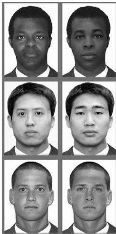
Abb. 1: Verschiedene Gesichter